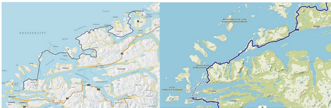
Figur 9 Dagens skilting av Nasjonal sykkelrute nr. 1 (til venstre) og Nasjonal sykkelruta over ny bru over Julsundet (til høyre).

I planomtalen saknar vi ei nærare vurdering av tema kollektivtilbod og gang- og sykkel, da mellom anna knytt til korleis Statens vegvesen ser for seg trase over Ørskogfjellet. Det kjem ikkje klart fram om det er tankar om å framleis ha sykkelrute der. Viss dette er plana, bør dette stå i klartekst slik at det ikkje er tvil kva som er plana.