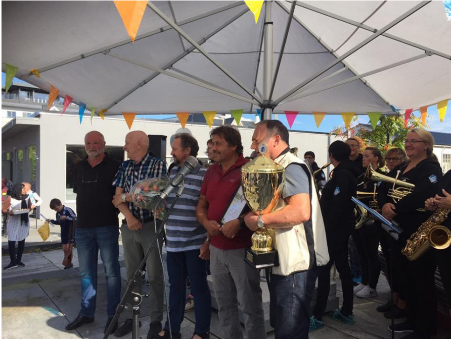
Representantar frå Kråkvikas Venner under prisutdelinga Årets Ros 2017.